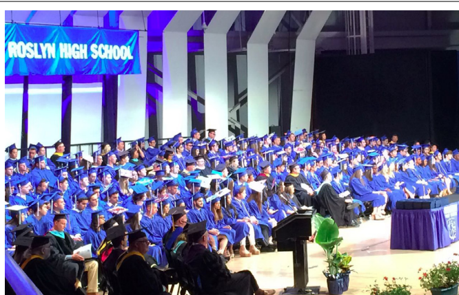
The 112th Roslyn High School Commencement in June 2018. Nearly every Roslyn senior goes on to higher education. La 112a ceremonia de graduación en junio de 2018. Casi todos los alumnos de Roslyn van a la educación superior.